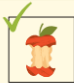
lose ohne Tüte